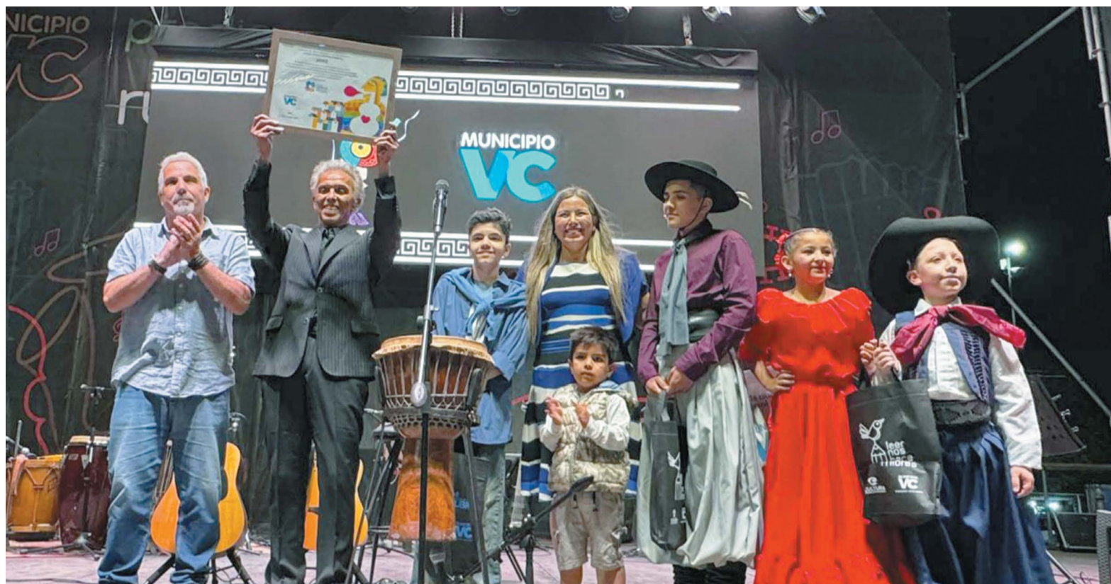
El recital de Jairo fue el broche de oro de tres noches inolvidables.