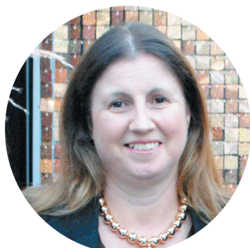
Victoria Fortuna Peluquería Vicky Fortuna @peluqueria_vickyfortuna