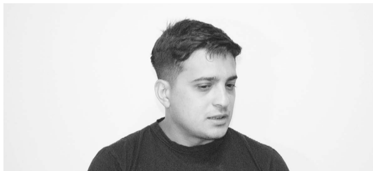
Cevey asumió este año un nuevo mandato al frente del barrio.

una situación similar en calle David Peña, entre Begnis y Sívori, donde un pastizal enorme da justo contra