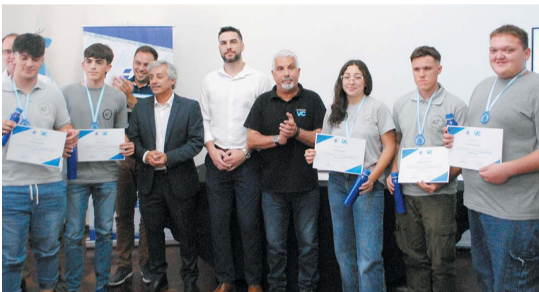
Cada alumno recibió su diploma y medalla (creada por estudiantes de Theobald).