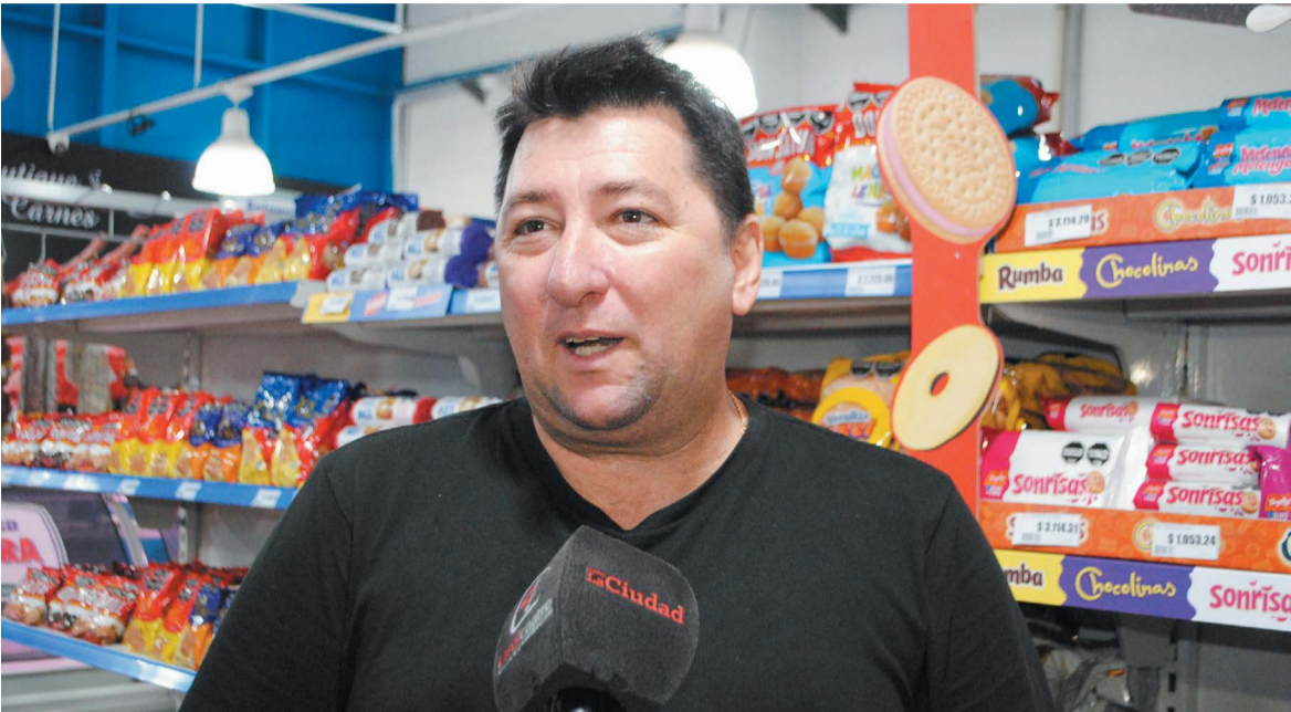
El local está ubicado en Carbonell 4242.