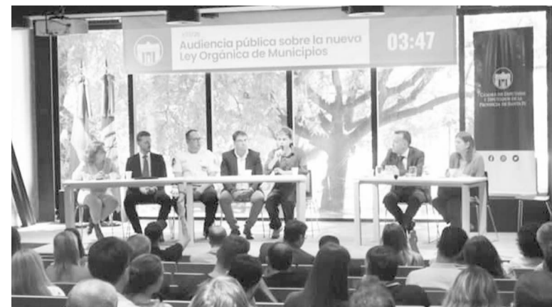
Más de 60 oradores aportaron sus ideas.

También se busca regular las competencias concurrentes que se ejercen junto con la provincia como son la salud y atención primaria, la seguridad ciudadana en clave de prevención, el hábitat y