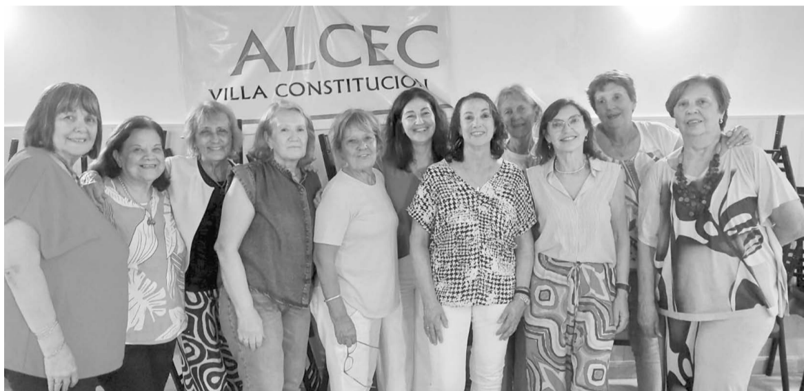
Expresaron una mezcla de orgullo, emoción y gratitud por el final de esta etapa.

Al formalizar su desvinculación, la institución expresó sentir una inmensa mezcla de orgullo, emoción y gratitud. Resaltó el orgullo por la trayectoria impecable que cada una construyó a lo largo de más de tres décadas. Manifestó emoción por el cariño y la humanidad con los que