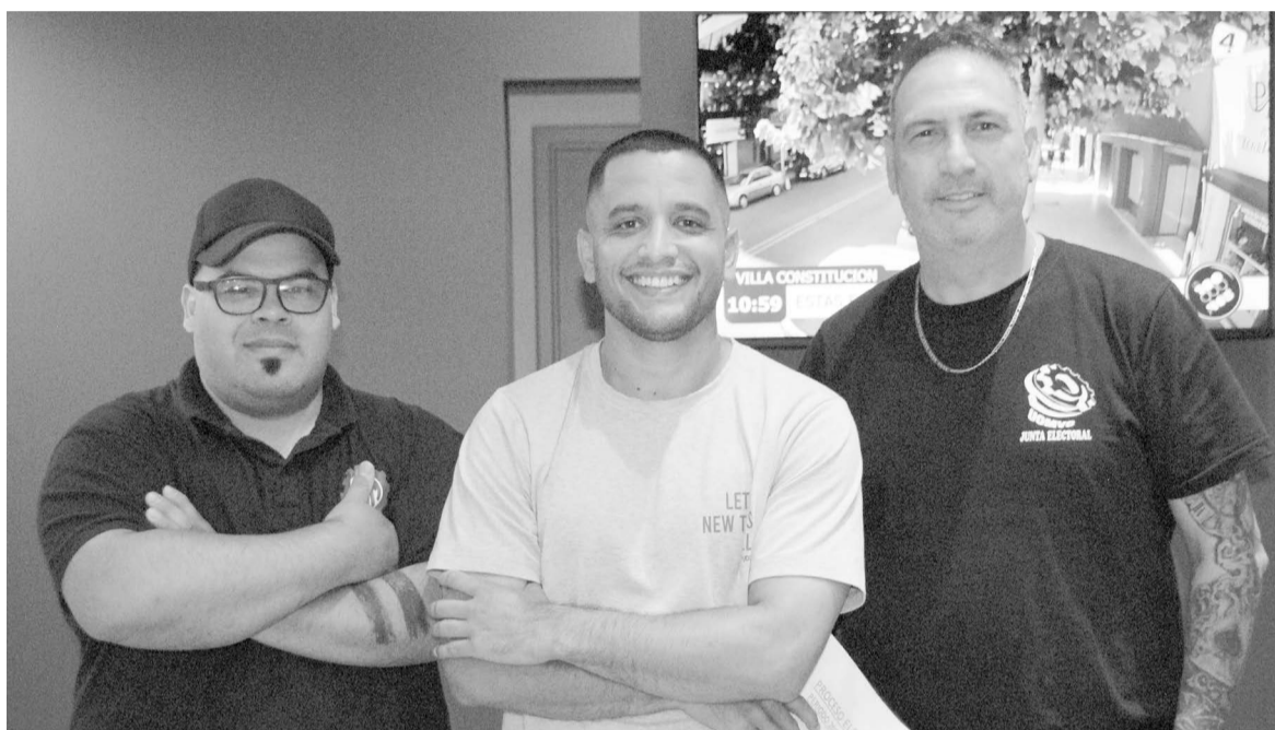
"Nuestro objetivo es llevar adelante las elecciones de manera democrática, libre e imparcial", expresaron.