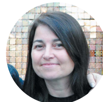
Vanesa Milich La Boutique @laboutique.ropayasesoramiento