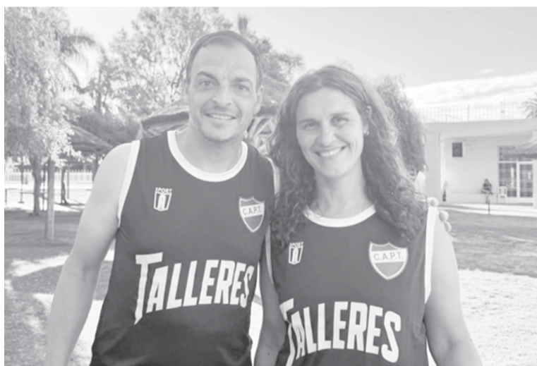
Es el segundo año consecutivo de los profes al frente de la Colonia.

Para esta edición, la franja etaria se extendió e incluyó a los niños de 3 años -la temporada anterior fue a partir de los 4-. “Invitamos a toda la comunidad, primero del club y después de toda la ciudad, a participar”, agregó el coordinador. La propuesta está destinada tanto a socios como a no socios de la ins-