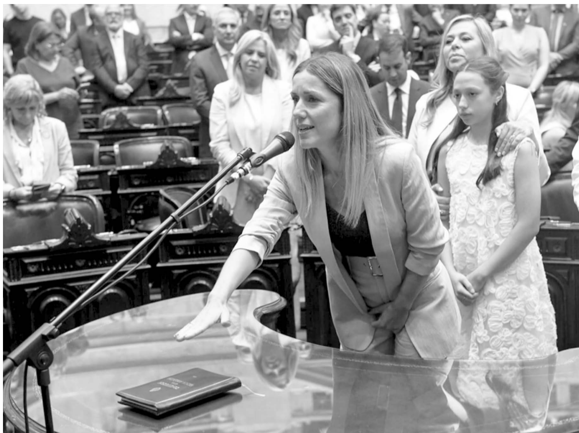
Juró “por Santa Fe, la militancia peronista, por Néstor y por Cristina libre”.

Respecto a su labor legislativa, uno de los ejes centrales de su gestión será “frenar cualquier medida que afecte a la industria santafesina, a las pequeñas y medianas empresas, a los trabajadores, jubilados y personas con discapacidad”. Indicó que estará presente en cada debate para buscar que el impacto del