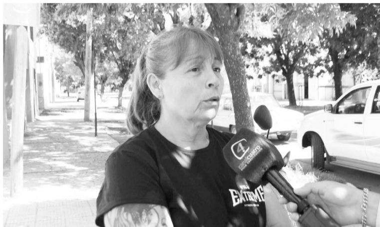
Anticipó que se presenta con un grupo renovado.

Sin embargo, persisten varias problemáticas. Uno de los reclamos centrales es el mal uso de