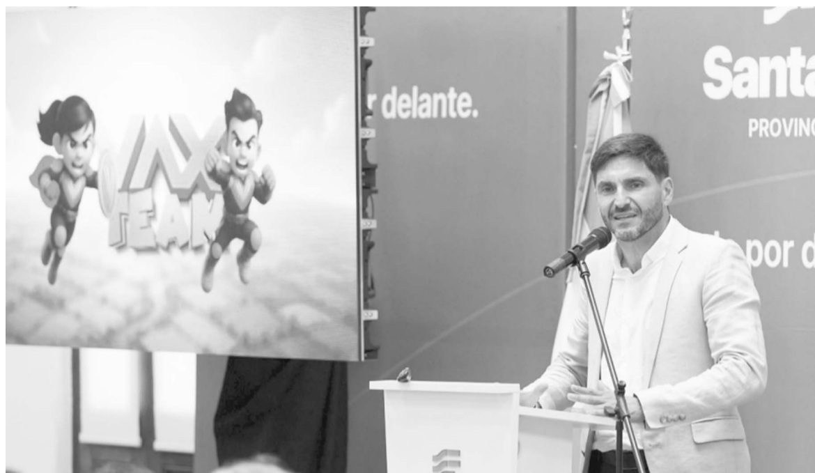
“Tenemos un plan innovador y único en Argentina”, sostuvo el Gobernador.

En el caso de los chicos y chicas que cumplen 11 años, recibirán una Tarjeta de Poder, asociada a la renovación de defensas y refuerzos del calendario.