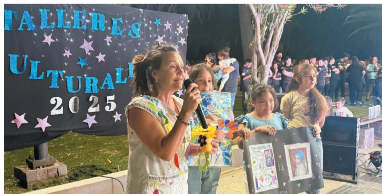
Cada taller hizo una exposición de sus trabajos.

Desde la Comuna se resaltó que la cultura no es solo una actividad, sino un espacio donde los vecinos "nos reconocemos, nos expresamos y construimos identidad co-