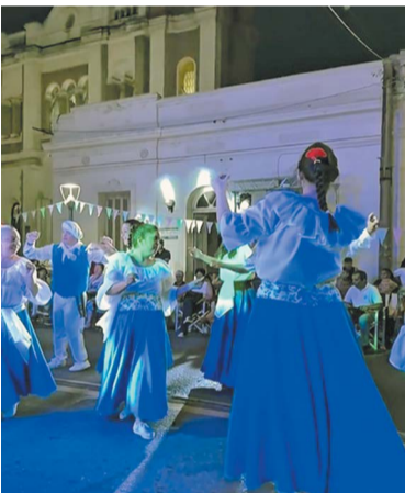
El evento se realizó sobre avenida San Martín.

Desde la Municipalidad se destacó que la realización de este tipo de eventos es clave para seguir bregando por más inclusión y más oportunidades para todas y todos los villenses, asegurando que una ciudad que integra, incluye e iguala es una ciudad que crece. Además, desde la organización se agradeció al intendente Jorge Berti por su apoyo constante a programas y proyectos que fortalecen la inclusión, y se reconoció a todas las instituciones, equipos profesionales y organizaciones del colectivo de discapacidad que hicieron posible la jornada, señalando que su trabajo cotidiano sostiene y amplía derechos.