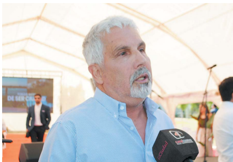
Berti participó del acto protocolar.

lleza de las instalaciones y el volumen de trabajo concretado en los últimos años, un logro que atribuyó a que, a pesar de que las gestiones se suceden, quienes llegan