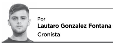
Por Lautaro Gonzalez Fontana Cronista

La “Peña Wayqera” se realizará en Fest Bar con la participación de artistas invitados, y el grupo busca recaudar fondos para participar por tercer año consecutivo en el tradicional encuentro nacional.