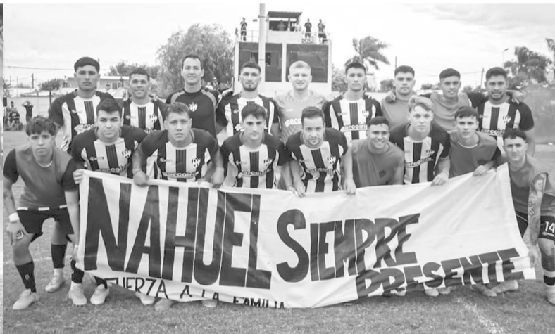
Empalme Central y Atlético Unión quedaron a mano en la primera final tras igualar en cero. Ahora todo se definirá en Arroyo Seco.

Con algunas insinuaciones, con más ganas que ideas, los protagonistas intentaron lastimar pero no pudieron concretar.