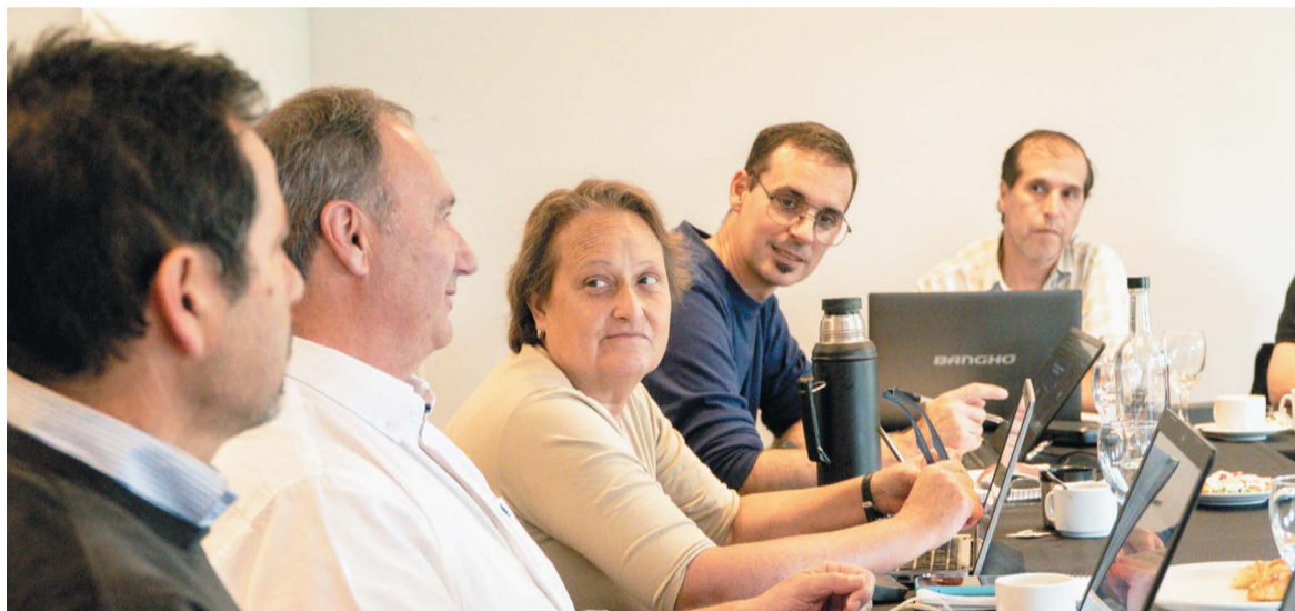
El Jurado reunido para definir los proyectos seleccionados.

Finalmente, Talleres Metalúrgicos Crucianelli fue distinguida con Medalla de Oro y mención en