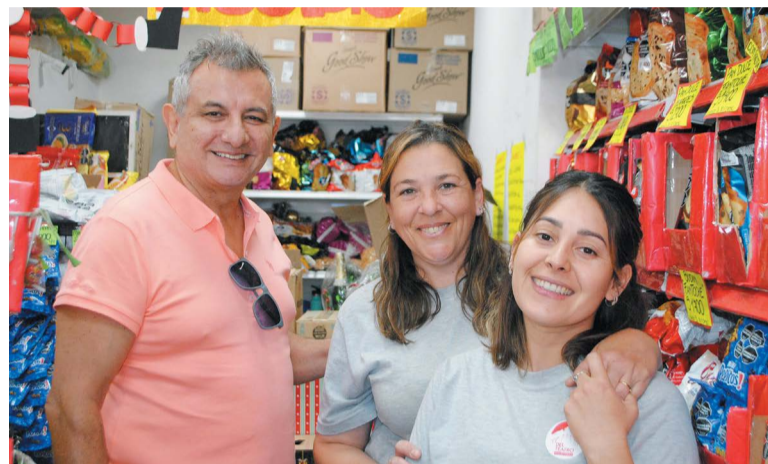
Con la mejor atención, los esperan en San Martín 1545.

Finalmente, Tourmier informó sobre los beneficios especiales y medios de pago. “Los martes contamos con 10% de descuento a jubilados y también aceptamos todos los medios de pago”, afirmó, detallando que ofrecen 20% de descuento