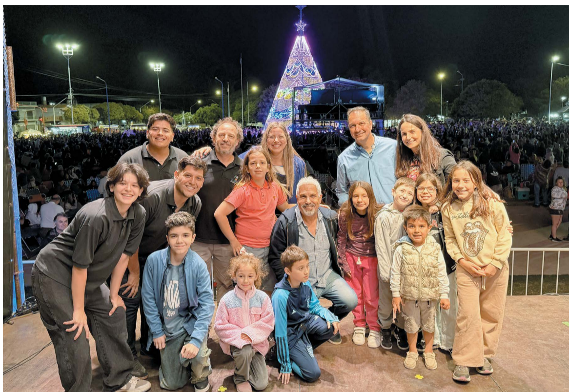
El arbolito ya se luce en el corazón de la ciudad.

Pidustwa adelantó una de las principales novedades de este año, que es la particularidad de que las personas podrán ingresar al árbol. Explicó que ya el año pasado quienes entraron por cuestiones técnicas pudieron experimentar una visión completamente diferente, por lo que decidieron sumar ese plus con una puerta de acceso. El Director de Innovación informó que, si el tiempo acompaña, este fin de semana se establecerá un día donde, de forma coordinada, la gente podrá ingresar a sacarse fotos, aunque aclaró que se cuidará la estructura y se organizará la entrada con una fila.